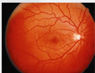
Normalno očesno ozadje

Dosedanje analize presejalnih programov so pokazale, da pri 20 do 24 % sladkornih bolnikov odkrijemo znake DR.